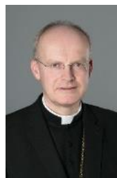
+ Dr. Franz-Josef Overbeck Bischof von Essen

Fulda, den 26. September 2019 Für das Bistum Essen