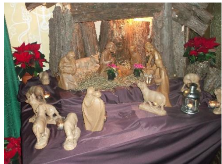
Krippe in St. Johann Baptist