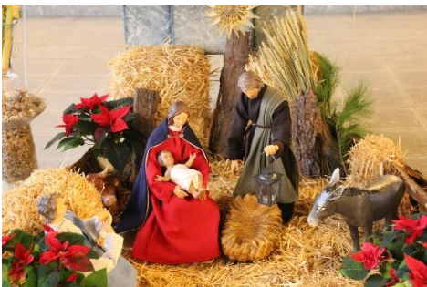
Krippe in Herz Jesu